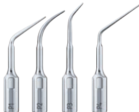
→ Nuevos Insert perio universal