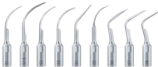
→ Nuevos Insert Scaling